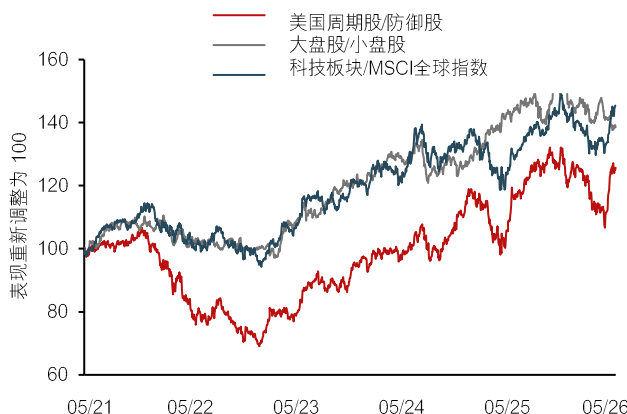
图 1：周期性板块或进行调整，我们偏好大盘股及具备盈利增长潜力的科技股

数据源：彭博、汇丰私人银行及财富管理，截至 2026 年 5 月 12 日。过往表现并非未来表现的可靠预测。MSCI：明晟