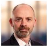
Willem Sels 汇丰私人银行及财富管理 环球首席投资总监